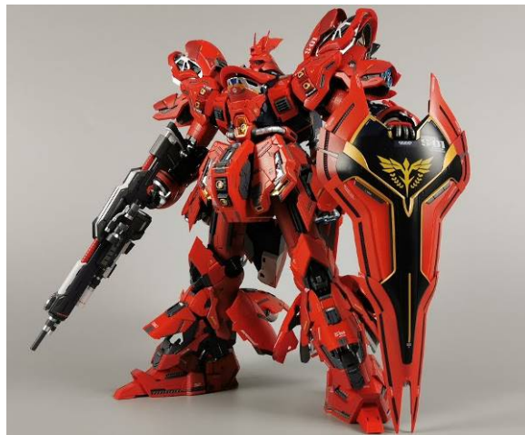
MC 集团生产的仿冒品