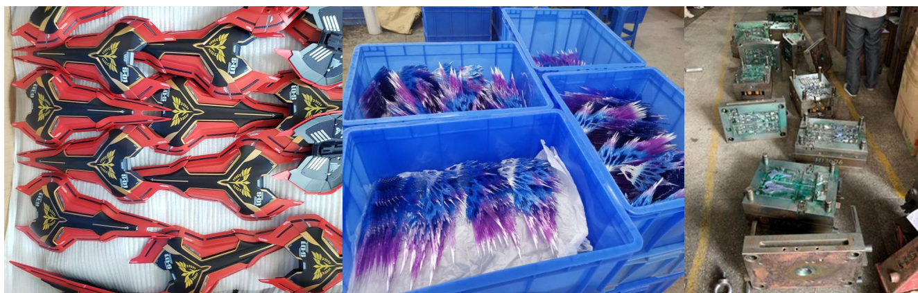
在 MC 工厂扣押的大量仿冒零件和模具