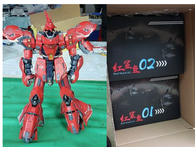
在工厂发现的组装完成的仿冒品